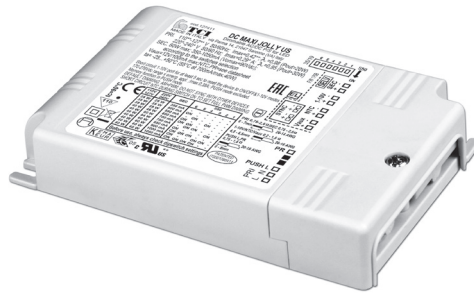
DC MAXI JOLLY US